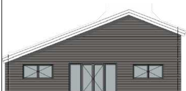
Rechter zijgevel west