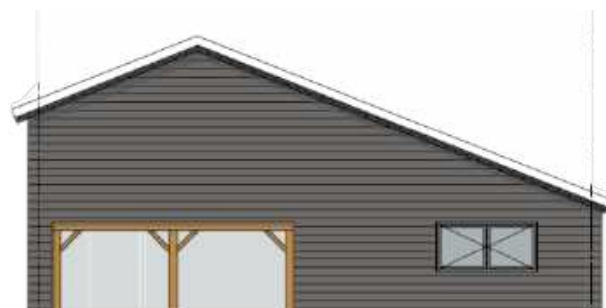
Linker zijgevel west