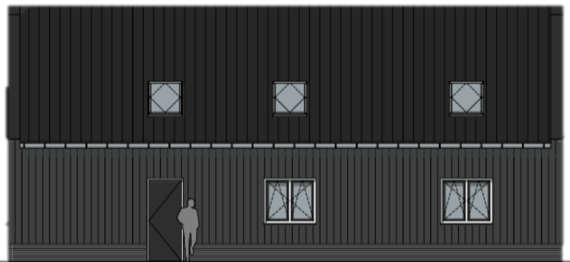
Rechter zijgevel noord