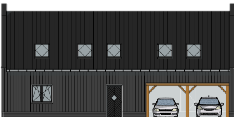
Linker zijgevel zuid